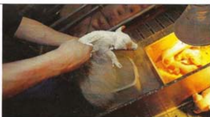
Het drogen van pasgeboren biggen is bijvoorbeeld te doen met stalpoeder