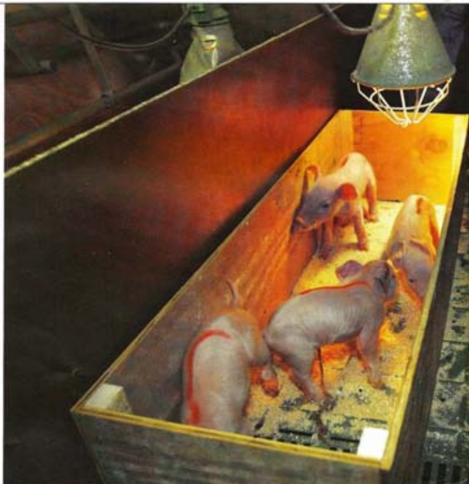
Door pasgeboren biggen die biest hebben gehad te merken en apart te zetten, is te zien welke biggen nog biest moeten hebben.

Eerste uren na geboorte cruciaal voor overleving