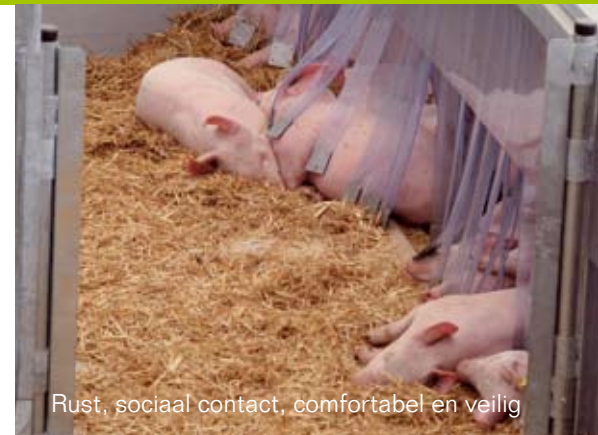
Rust, sociaal contact, comfortabel en veilig