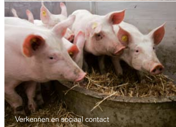
Verkennen en sociaal contact